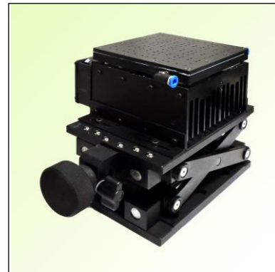
ステージ本体+ラボジャッキ PTC-410V (100×100mm)