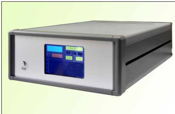
専用温度制御電源